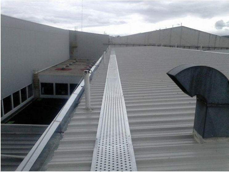
Galería de Imágenes de Lámina Acanalada para Techos R-101-Zintro-Alum-VD